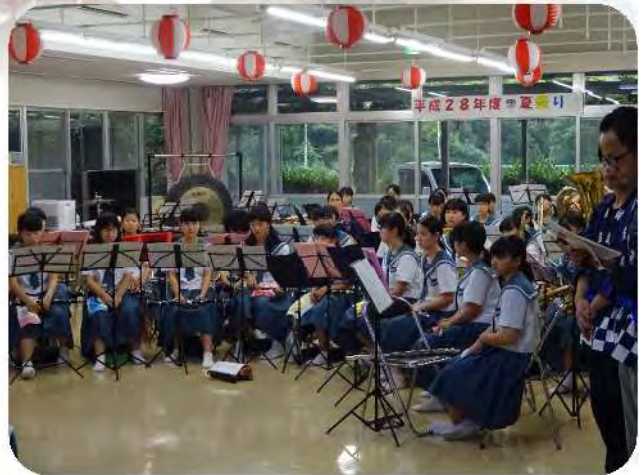
松元中学校 吹奏楽部