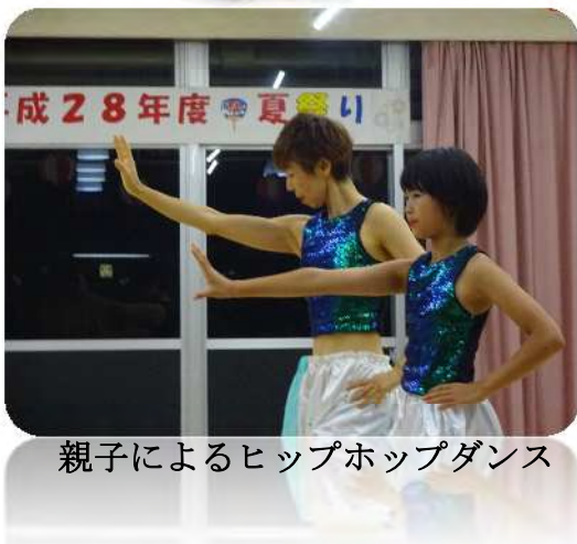
親子によるヒップホップダンス