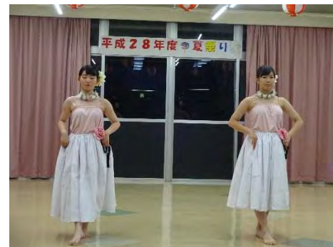
城西高校生徒によるフラダンス