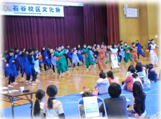
◆石谷小学校 6 年生による舞台発表◆ 創作ダンス 「ヤマタノオロチ」

校区文化祭に出かけました。施設からも利用者様が日ごろ取組んでおられた貼り絵や陶芸の作品の展示を行いました。