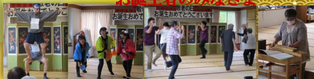
組体操 復活キャンディーズ 大盛況総踊り 大正琴演奏