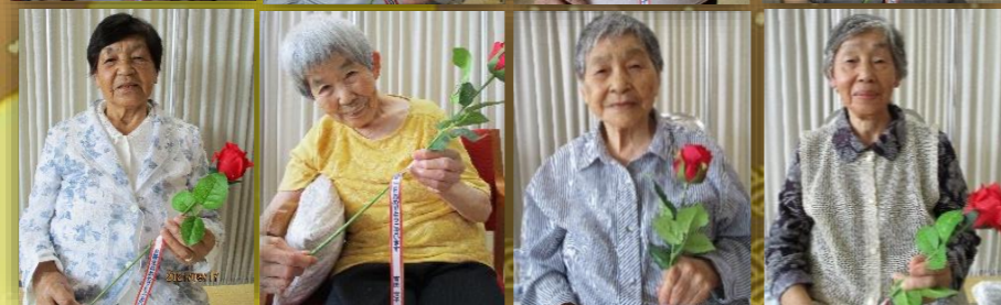
お誕生者のみなさま