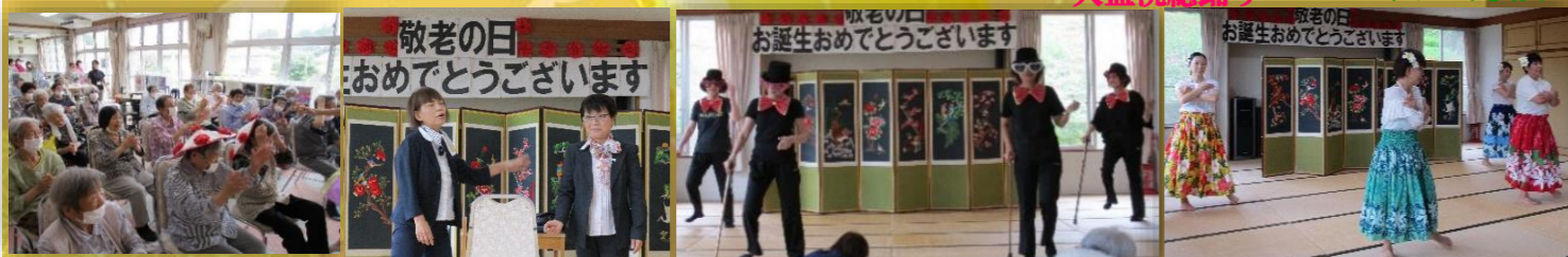
拍手喝采です 新旧?バズガール ダンシングヒーローズ 松元ハワイアンズ

ご挨拶 コロナ禍により、各地域において敬老祝賀会を余儀なく中止されるところがあり、直接お祝いを申し上げることができませんので、紙面にてお祝い申し上げます。また、今回敬老の日を迎えられました皆様方に心よりお慶び申し上げます。鹿児島県内では、今年度中に100歳（大正10年4月1日から大正11年3月31日生）になられる方々は、9月現在で、991人（男性122人、女性869人）。ご利用者からも驚きや目標に頑張るとい声がありました。さて、今年度は東京オリンピック、パラリンピックが開催されました。目標に向かって努力してきた各国の選手の姿に、感化されるものがあり、胸が熱くなることでした。