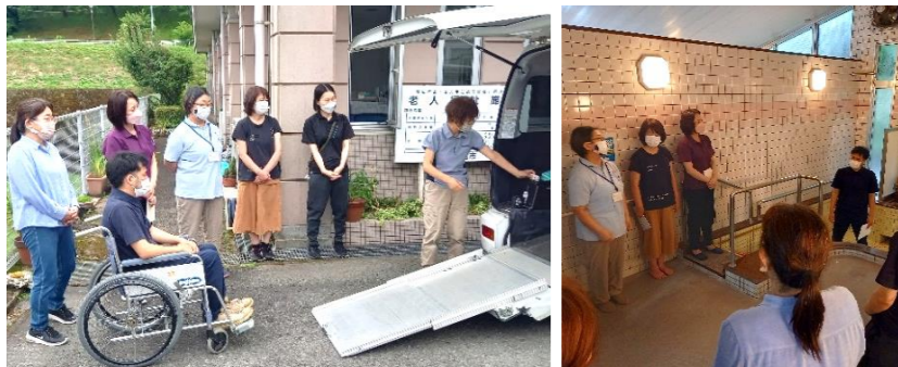
送迎車を使用して車椅子セットの仕方 浴室での救急対応

介護現場における介護事故防止のためのリスクマネジメントは、事故のリスクを事前に把握し、事故防止のためのリスクや対応策を共有し、管理していくため必要な取り組みです。今回の施設内研修は、入浴、送迎での危険を回避すべく、職員間で意見を出し合いました。これからも安心安全でご支援いたします。